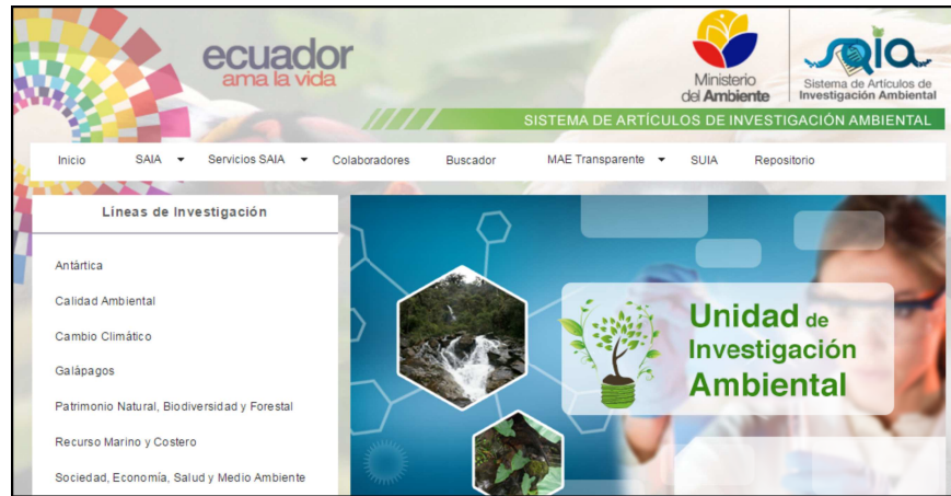
Figura 3: Pantalla principal Sistema de Artículos de Investigación Ambiental - SAIA

LENIA -> Lineamientos Estratégicos Nacionales de Investigación Ambiental. Al dar click en la opción “LENIA” se desplegará la siguiente pantalla (Ver Figura 4).