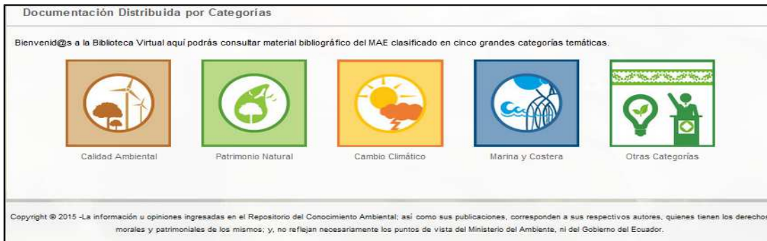
Figura 6: Pantalla principal Biblioteca Virtual

Al dar click en cada categoría, se desplegará un menú que cuenta con los parámetros tipo de archivo, título, categoría y acciones donde se podrá visualizar y descargar el documento seleccionado. (Ver Figura 7).