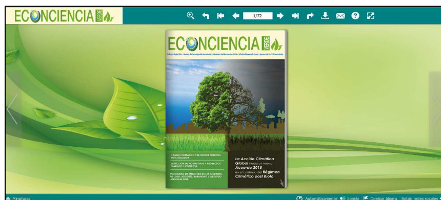
Figura 9: Pantalla principal Boletín Electrónico

BOLETÍN ELECTRÓNICO DE INVESTIGACIÓN AMBIENTAL “ECONCIENCIA VERDE” , busca fortalecer y expandir los mecanismos de información, comunicación y difusión de la investigación ambiental, donde se incorpora información idónea y veraz sobre la investigación que se lleva a cabo en nuestro país. (Ver Figura 9 ).