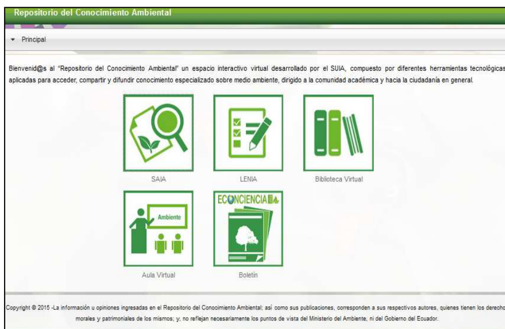
Figura 2: Pantalla principal del Repositorio del Conocimiento Ambiental

Posteriormente, podrá visualizar la siguiente pantalla donde se presenta la Bienvenida y el menú principal de navegación del Repositorio del Conocimiento Ambiental - RCA ( Ver Figura 2 ).