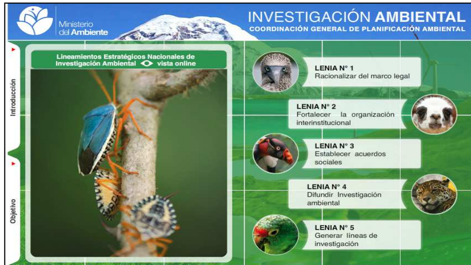
Figura 4: Pantalla principal del aplicativo de LENIA

LENIA -> Lineamientos Estratégicos Nacionales de Investigación Ambiental. Al dar click en la opción “LENIA” se desplegará la siguiente pantalla (Ver Figura 4).