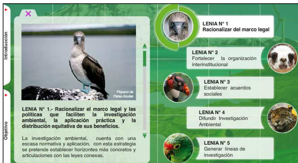
Figura 5: Pantalla descripción de los LENIA

Así mismo, al dar click en cada LENIA se desplegará su definición, como se muestra en la siguiente pantalla. (Ver Figura 5).