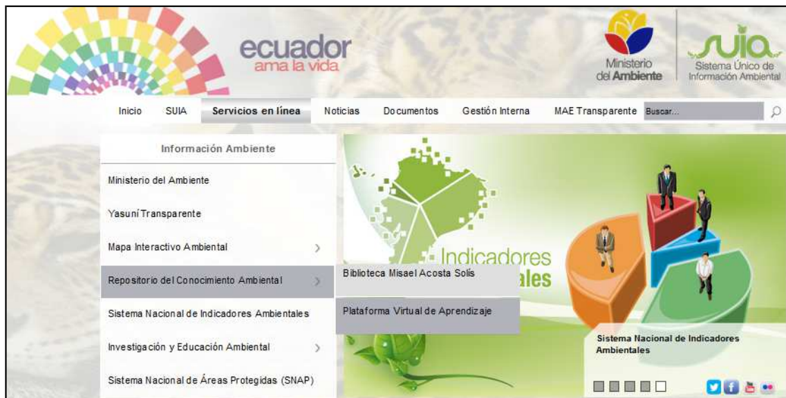
Figura 1: Ingreso al Sistema Único de Información Ambiental

Para el ingreso al Repositorio del Conocimiento Ambiental diríjase a la página del Sistema Único de Información Ambiental SUIA: http://suia.ambiente.gob.ec/ y elija la opción Repositorio del Conocimiento Ambiental ( Ver Figura 1 ).