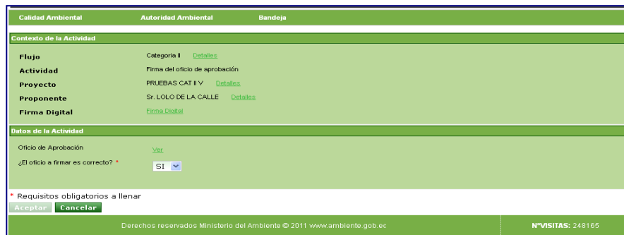
Figura 1. Proyecto que se firmará digitalmente

Una vez listados los proyectos dentro de la bandeja de tareas, debe seleccionar el proyecto a firmar (Ver figura: 1).