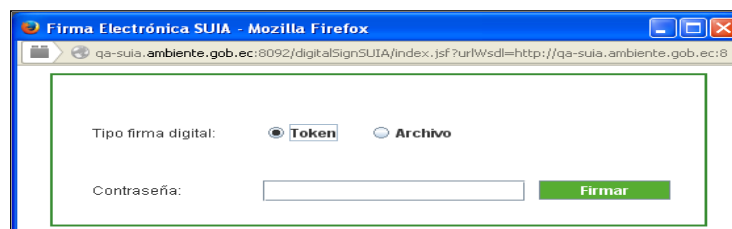
Figura 2. Módulo de firma digital

Al mostrar la pantalla para la firma electrónica, es posible que se muestre la opción de activar plugin de java, donde solo debe activar.