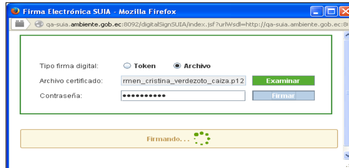
Figura 3. Pantalla para la Firma Digital por Archivo

Cuando selecciona Token: deben ingresar la contraseña del certificado y dar clic en la opción “ Firmar ” (Ver figura 2).