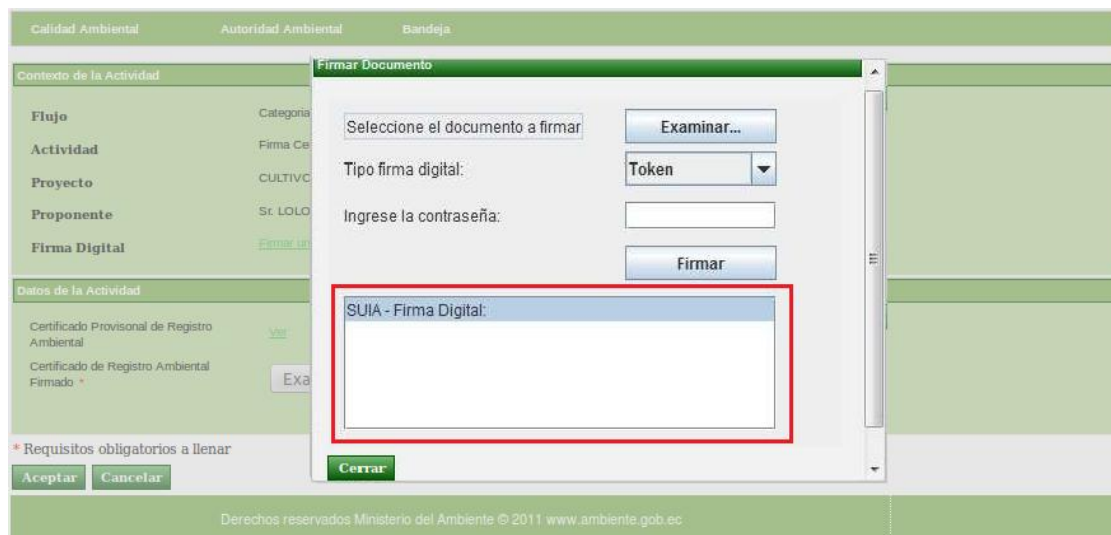
<Figura 5>: Firmar documento electrónicamente.