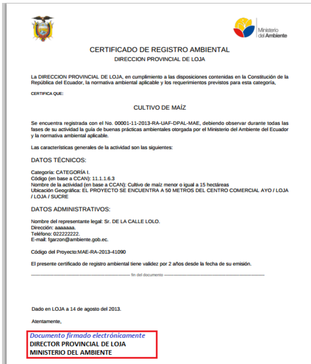
<Figura 6>: Revisión técnica analista – Registro de Categoría.