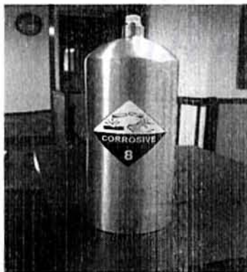
Presentaciones de 34.5 kg